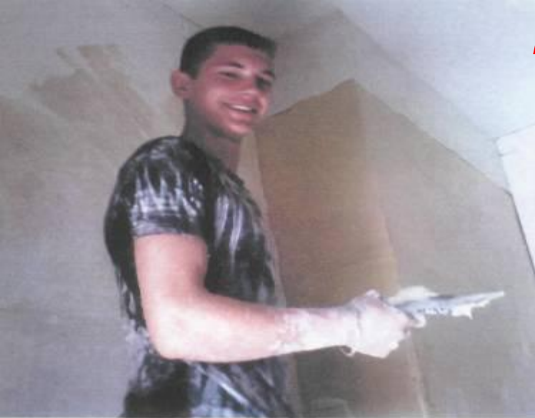
Создание радио центра из заброшенной кладовки