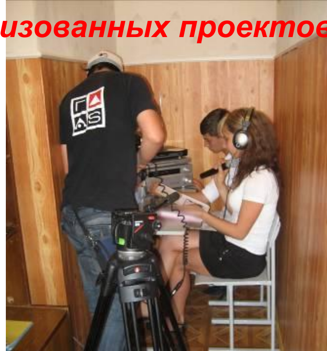
Первый выход школьного радио в эфир!!