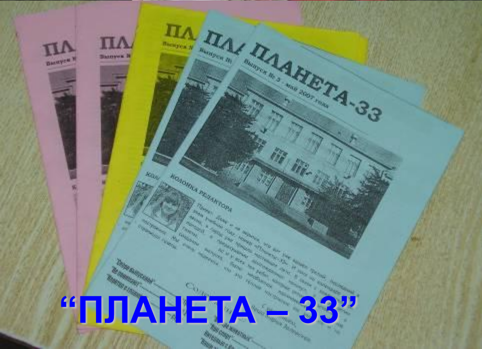
“ПЛАНЕТА – 33”